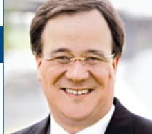
Armin Laschet MdB