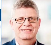
Christian Haase MdB