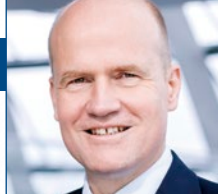
Ralph Brinkhaus MdB