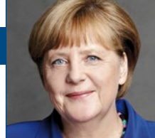
Angela Merkel MdB